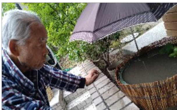
【メダカを観察する理事長】

さてどう景観を損なわず固定するか試行錯誤してみました。が巧いはず、どんなものかと悩んでいましたところ、答えは意外にも簡単に出ました。物づくりはできるだけシンプルが私の信条でもあり、玄関の二輪ざしを見て、そうだ、花と同じ様に花瓶に傘を立てれば良いのではとヒントを得、使っていない花瓶に傘を立てるのを小石で動かなくしたところ、思いのほか巧く固定でき見映えも悪くなく突風に骨は折られましたが、花鉢の中に傘は残っていました。初めての水槽づくりで一番苦勞したところですが、何でもないとどこに道はあるものだと学習しました。