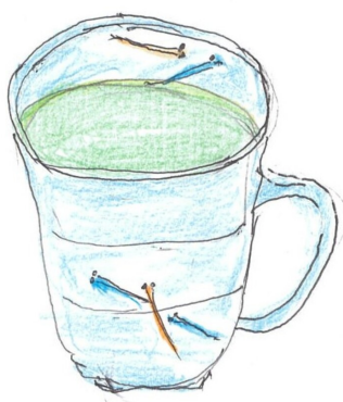
【10年以上使っているマイカップ】

そう言えば、普段使っていますマイカップ、メダカの模様が描かれています。一〇年以上使っているのに気が付いていませんでした。孫からメダカにこだわって使っているのとの問いで気が付きました。人間外見えていて見えていないものか、故人となりまして家内でもなかったかカップの柄のメダカと同じでなかったのではないかと少しセンチになりました。